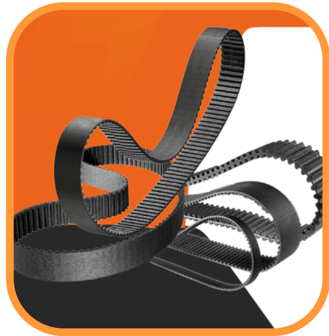
Bandas Automotrices e Industriales