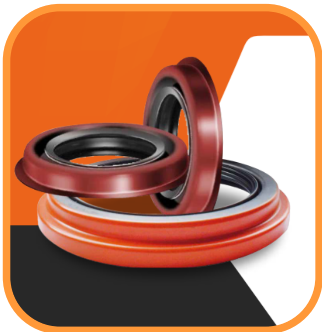
Retenedores Automotrices e Industriales