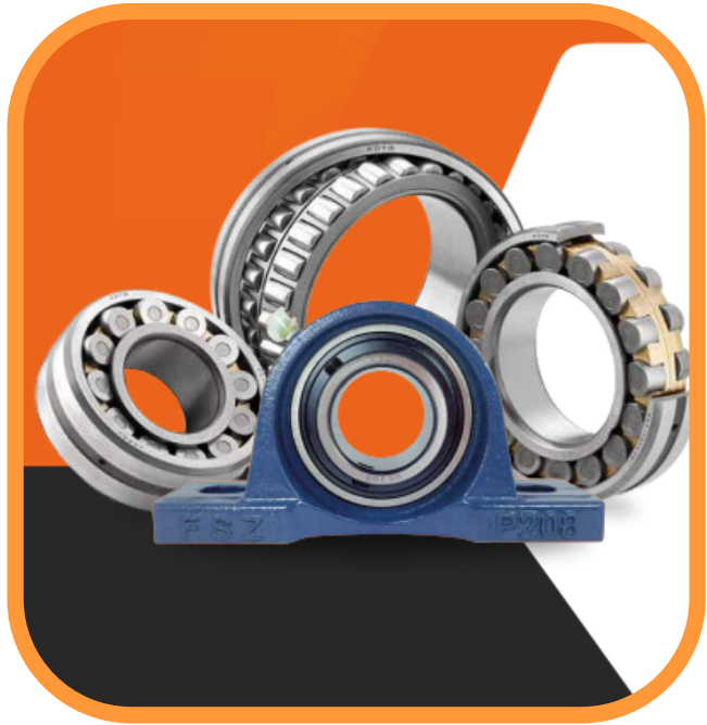
Rodamientos y Chumaceras